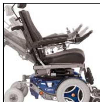
Elektrisk justerbar ryg.