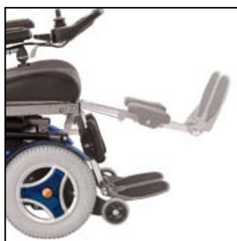
Elektrisk justerbare benstøtter.